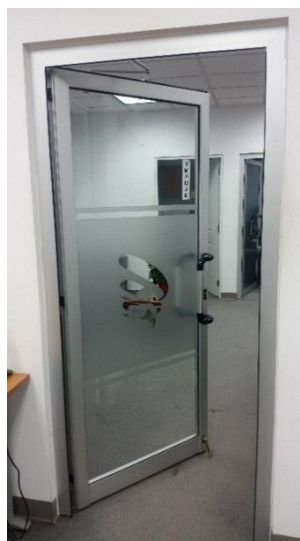
Ejemplo de puerta P-40

Deberán colocarse puertas batientes, abisagradas con cristales transparentes templados de 3/8”, laminado frost con logo de la institución, sujetos con conectores en acero inoxidable en laterales, perfilierías P-40 olor plata y puños de acuerdo a la imagen suministrada a continuación.