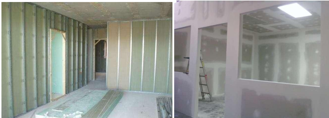
Muros de sheet-rock

Se construirán nuevos muros en Yeso o sheet-rock a dos caras, 3 5/8"x10', plancha blanca de 1/2", calibre regular, con estructura de refuerzos metálica (Parales y Durmientes), con una terminación en muro de 13cms.