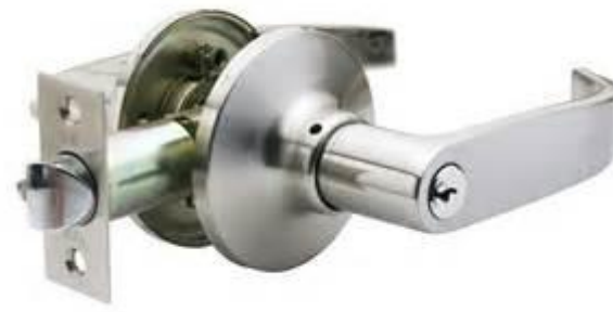
Llavín tipo L