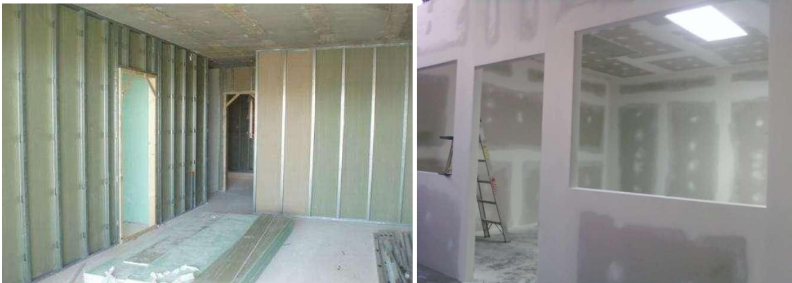
Muros de sheet-rock

Se construirán nuevos muros en Yeso o sheet-rock a dos caras, 3 5/8"x10', plancha blanca de 1/2", calibre regular, con estructura de refuerzos metálica (Parales y Durmientes), con una terminación en muro de 13cms.