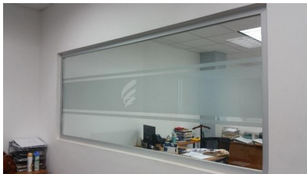
Ejemplo de cristal fijo instalado en la institución.

Suministro e instalación de paños fijos de cristal templado de 3/8", laminado frost de acuerdo al logo de la institución, sujetos con conectores en acero inoxidable en laterales y perfilaría P-40 color plata superior e inferior.