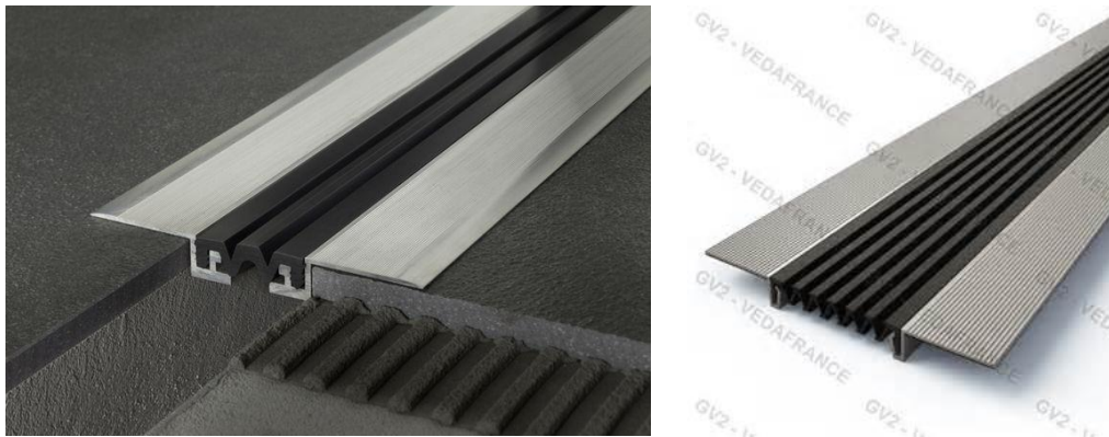
Cubre faltas de juntas horizontales (de piso)

A continuación, anexamos unas imágenes de este tipo de juntas.