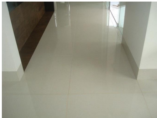
Porcelanato y derretido de juntas