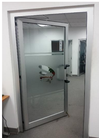
Ejemplo de puerta P-40

Deberán colocarse puertas batientes, abisagradas con cristales transparentes templados de 3/8", laminado frost con logo de la institución, sujetos con conectores en acero inoxidable en laterales, perfilierías P-40 color plata y puños de acuerdo a la imagen suministrada a continuación.