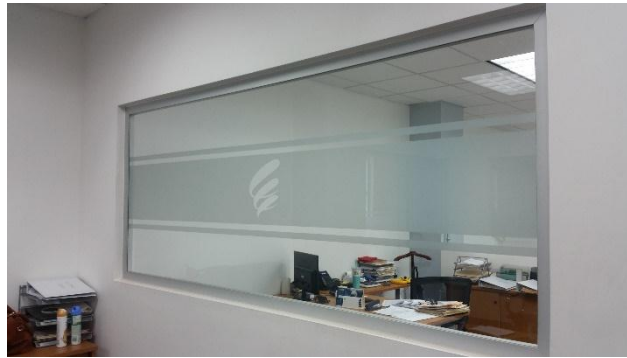
Ejemplo de cristal fijo instalado en la institución.