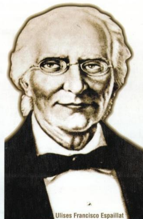
Ulises Francisco Espaillat

Dirección General de Ética e Integridad Gubernamental