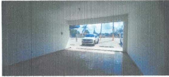
Ilustración 3 Interiores local 7A