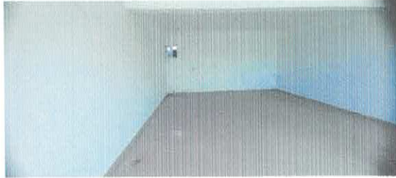
Ilustración 5 Interiores Local 7A

El alcance de las intervenciones propuestas para la adecuación del local se resumen en el listado descrito a continuación: