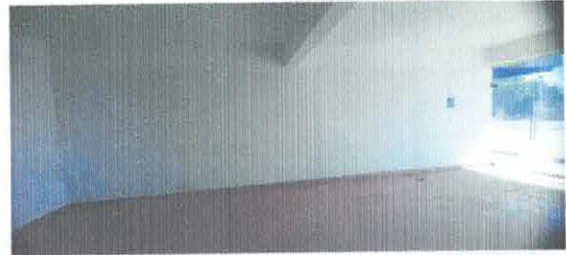
Ilustración 4 Interiores Local 7A