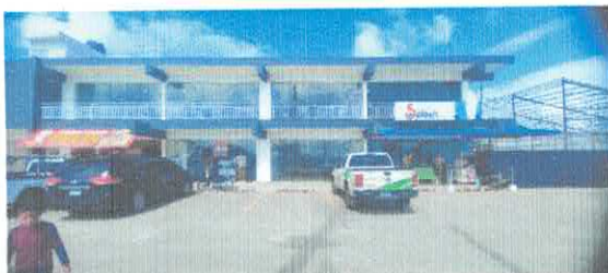
Ilustración 1 Plaza Cenoví