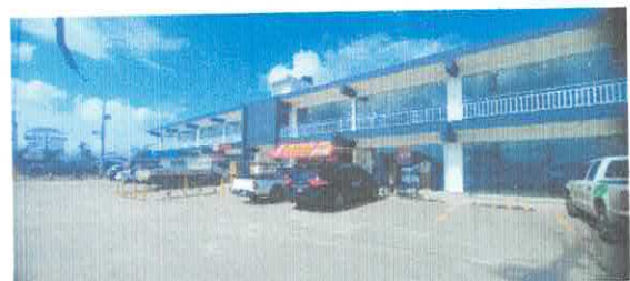
Ilustración 2 Plaza Cenoví